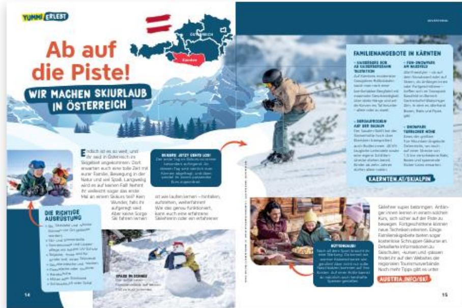
Bsp. Österreich Tourismus (2/1 Seite)