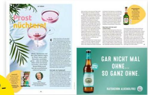
Bsp. Ratscherrn alkoholfrei

Die Waren werden nachweislich bestellt – denn vor jeder Ausgabe informiert der perle-Newsletter die Filialen rechtzeitig über alle beworbenen Produkte im Magazin