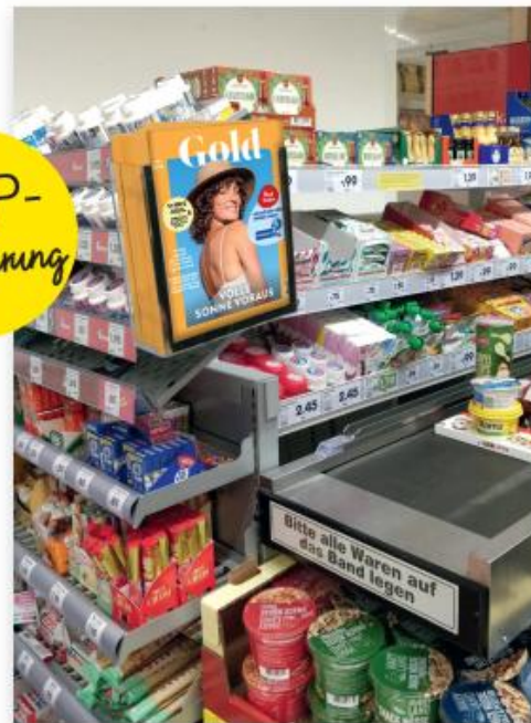
Attraktive Kassenplatzierung bei Netto Marken-Discount