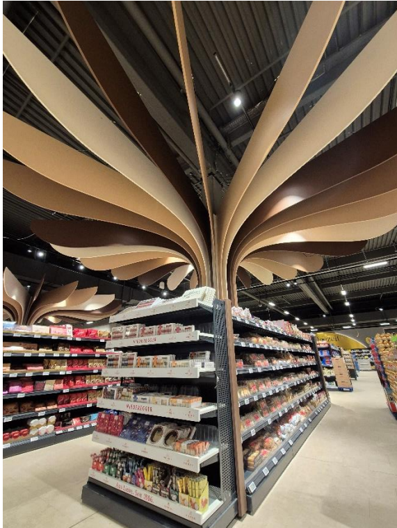
BU: Die Süßwarenwelt ist dekorativ mit zwei hölzernen Bäumen eingefasst.