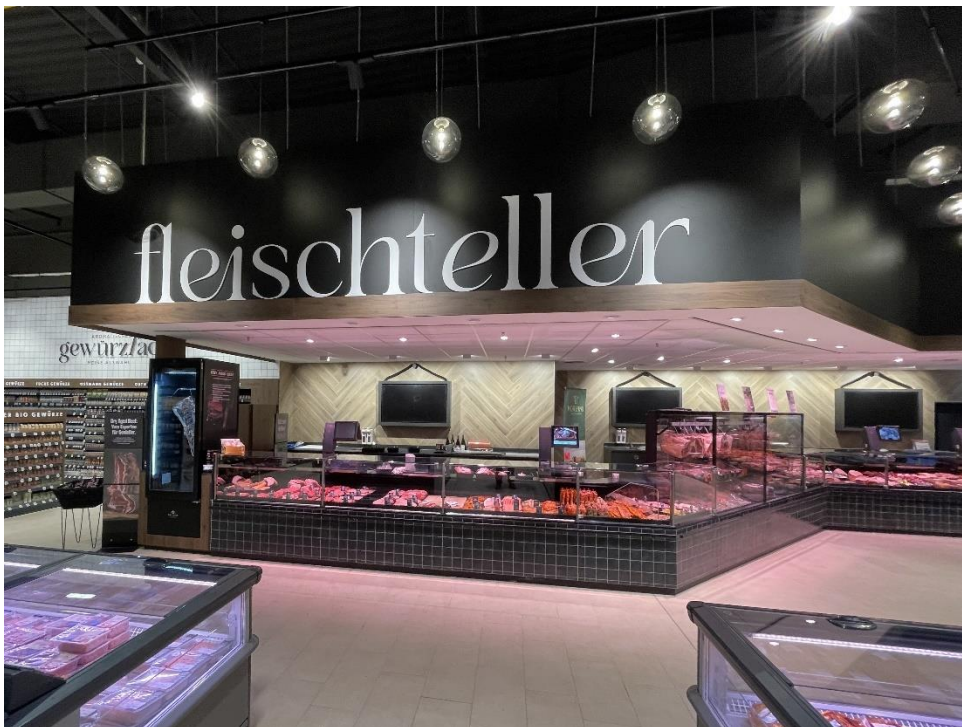
BU: An der knapp 24 Meter langen Frischetheke für Fleisch und Wurst sowie Käse erwartet Kund:innen eine vielfältige Produktauswahl sowie fachkundige Beratung.