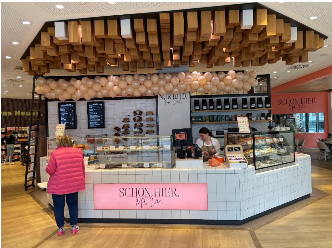
Abbildung 2 Bedientresen in der Mitte des Pop-Up-Stores