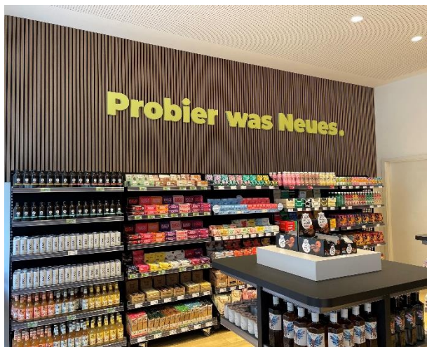
Abbildung 4 Regal von FoodStarter by EDEKA mit neuen Foodinnovationen