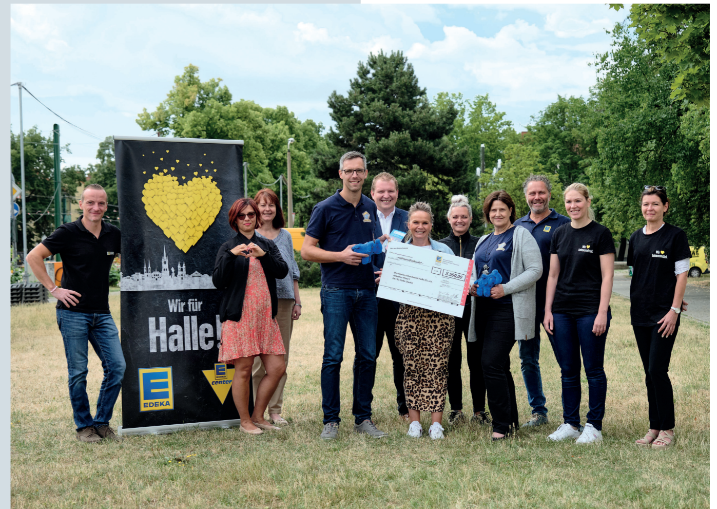
Die EDEKA-Kaufleute der „Wir für Halle“-Gruppe übergaben den symbolischen Spendenscheck an das Team des Kinderschutzbundes Halle (Saale) e. V.

Der Kinderschutzbund Halle (Saale) e. V. setzt sich seit seiner Gründung im Jahr 1992 für die Belange von Kindern, Jugendlichen und deren Familien ein und bündelt unterschiedliche Beratungs-, Begegnungs- und Freizeitangebote an einem Ort. Die Vielzahl an familienentlastenden Angeboten ist dabei groß. Diese dienen in erster Linie der Prävention: Probleme sollen gar nicht erst entstehen oder sich verfestigen. Zusätzlich werden weitere Projekte wie die Schulverpflegung bedürftiger Kinder vom Kinderschutzbund Halle initiiert. Die EDEKA Minden-Hannover spendete 2.500,- Euro.